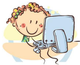
2. ПОЛОЖЕНИЕ МОНИТОРА