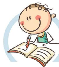
4. СИДИТЕ ПРАВИЛЬНО