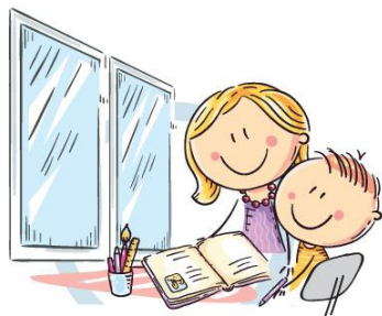
1. ЕСТЕСТВЕННОЕ ОСВЕЩЕНИЕ

ЕДИНЫЙ КОНСУЛЬТАЦИОННЫЙ ЦЕНТР РОСПОТРЕБНАДЗОРА 8-800-555-49-43