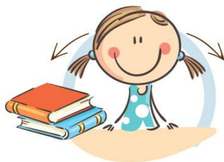
1. ФИЗКУЛЬТМИНУТКА ДЛЯ УЛУЧШЕНИЯ МОЗГОВОГО КРОВООБРАЩЕНИЯ