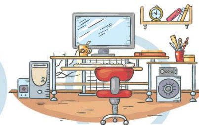
5. СООТВЕТСТВИЕ МЕБЕЛИ