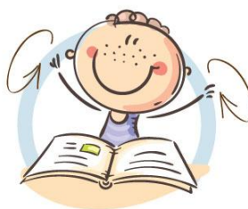
2. ФИЗКУЛЬТМИНУТКА ДЛЯ СНЯТИЯ УТОМЛЕНИЯ С ПЛЕЧЕВОГО ПОЯСА И РУК