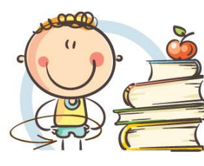
3. ФИЗКУЛЬТМИНУТКА ДЛЯ СНЯТИЯ УТОМЛЕНИЯ КОРПУСА ТЕЛА