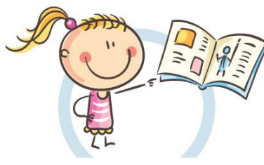
3. РАССТОЯНИЕ ДО КНИГ