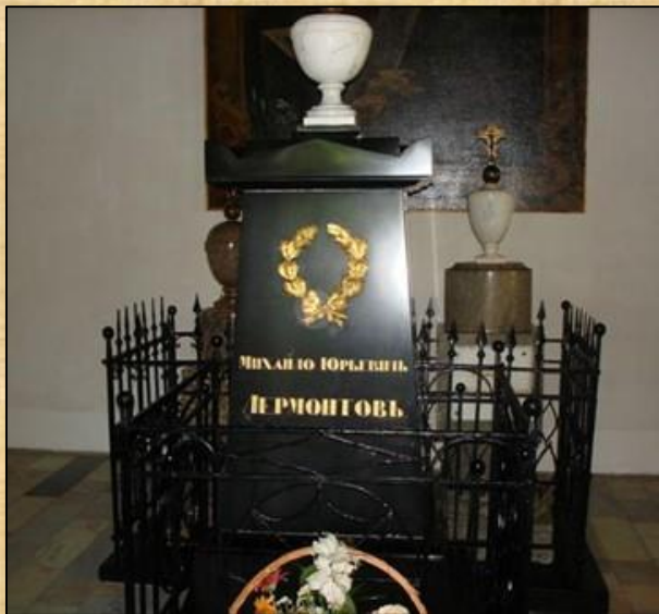
Надгробный памятник на могиле М. Ю. Лермонтова в Тарханах.

В январе 1841 получил отпуск и уехал в Санкт-Петербург, а возвращаясь, остановился в Пятигорске, где 15 июля (27 июля) 1841 года и произошла роковая ссора с отставным майором Мартыновым, закончившаяся дуэлью и смертью поэта.