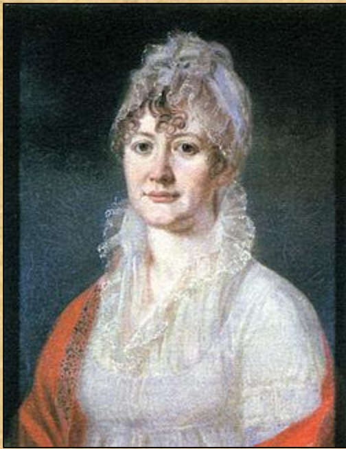
Елизавета Алексеевна Арсеньева, бабушка поэта

Елизавета Алексеевна, бабушка поэта, была «не особенно красива, высокого роста, сурова и до некоторой степени неуклюжа». Обладала недюжинным умом, силой воли и деловой хваткой. Происходила из знаменитого рода Столыпиных.