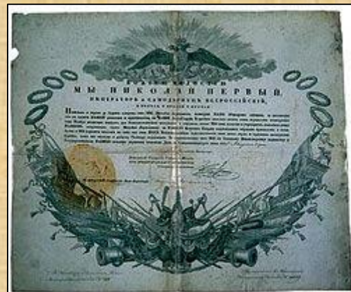
Патент М. Ю. Лермонтову на чин лейб-гвардии корнета.

В сентябре 1834 года Лермонтов был выпущен корнетом в лейб-гвардии Гусарский полк.