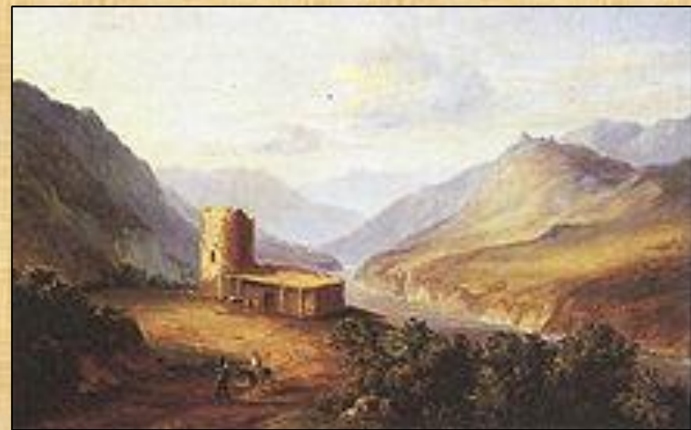
Военно-Грузинская дорога близ Мцхеты. 1837. Картина М. Ю. Лермонтова.

Во время ссылки особенно раскрылось художественное дарование Лермонтова, с детства увлекавшегося живописью. Ему принадлежат акварели, картины маслом, рисунки, пейзажи. Лучшие из них связаны с Кавказом.