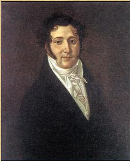
Ю. П. Лермонтов (1787—1831 гг.), отец поэта