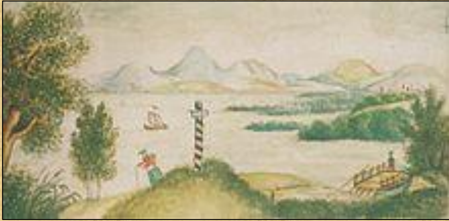
Кавказский пейзаж с озером, детский рисунок Лермонтова из альбома.

Летом 1825 года бабушка повезла Лермонтова на воды на Кавказ. Детские впечатления от кавказской природы и быта горских народов остались в его раннем творчестве ("Кавказ", 1830; "Синие горы Кавказа, приветствую вас!..", 1832).