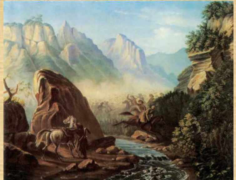
М. Ю. Лермонтов. Перестрелка в горах Дагестана. 1840–41 гг.

Вторая ссылка на Кавказ кардинальным образом отличалась от того, что ждало его на Кавказе несколькими годами раньше. Прибыв на Кавказ, Лермонтов окунулся в боевую жизнь и на первых же порах отличился, согласно официальному донесению, «мужеством и хладнокровием».