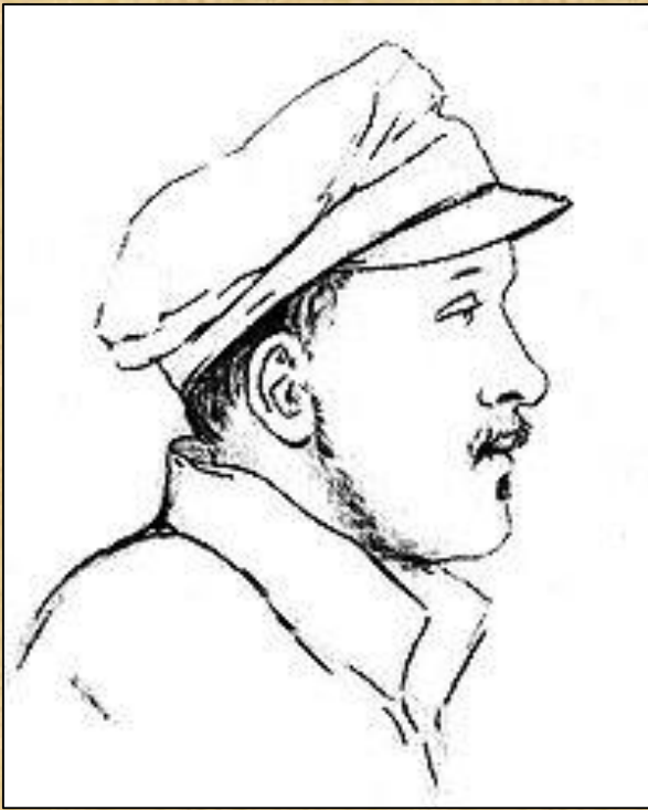
М. Ю. Лермонтов после валерикского боя. Пален Д. П. 23 июля 1840 г.

Вторая ссылка на Кавказ кардинальным образом отличалась от того, что ждало его на Кавказе несколькими годами раньше. Прибыв на Кавказ, Лермонтов окунулся в боевую жизнь и на первых же порах отличился, согласно официальному донесению, «мужеством и хладнокровием».